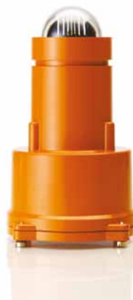
Rörvik Timber Högländet